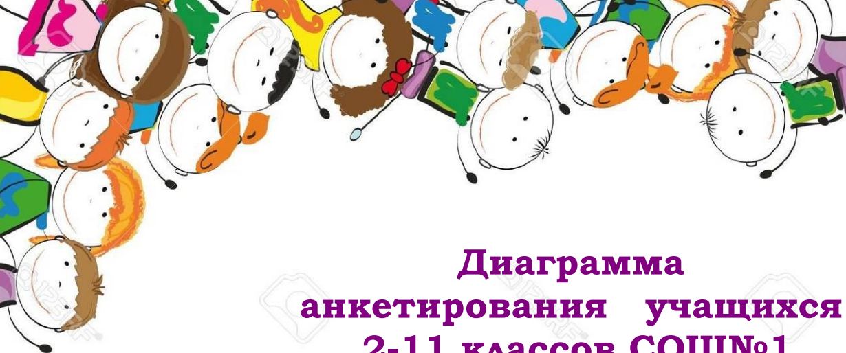
Диаграмма анкетирования учащихся 2-11 классов СОШ№1

В голосовании и приняло участие 85 человек