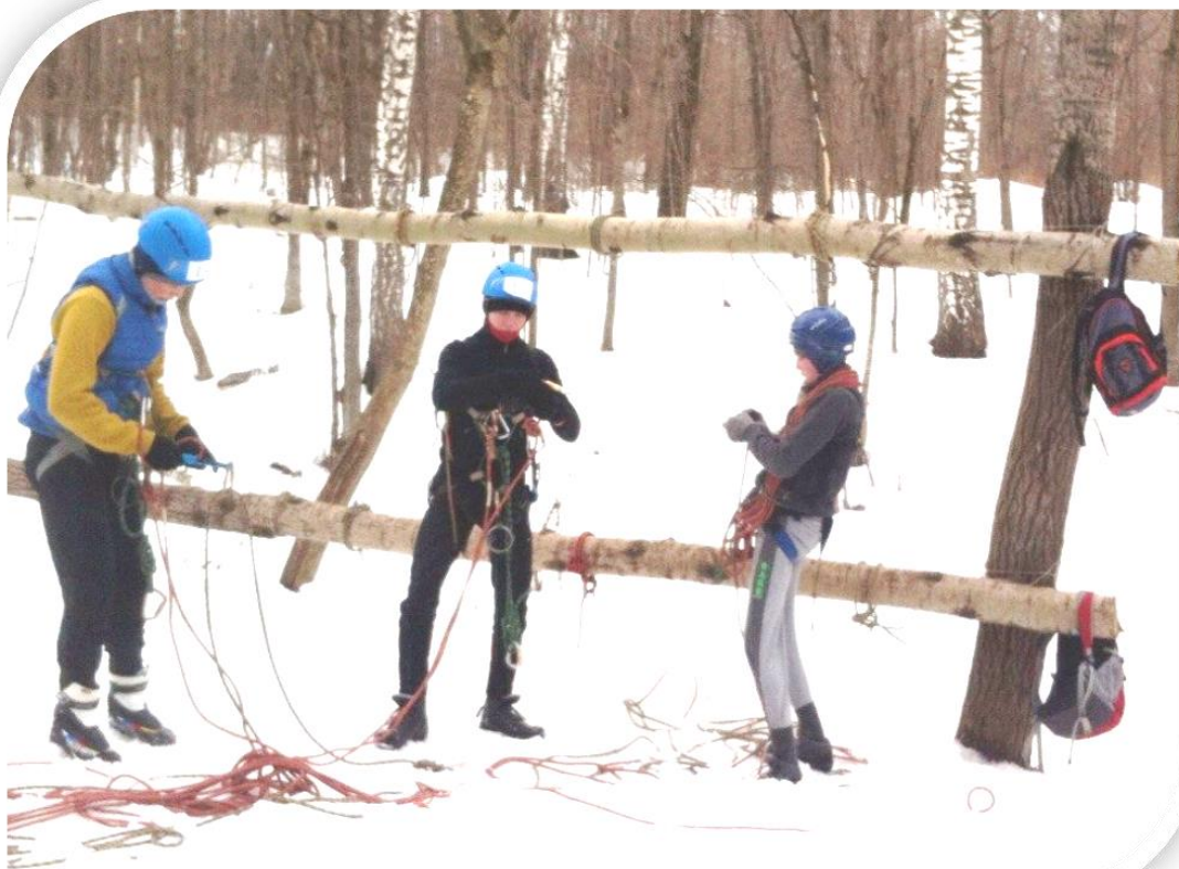
Команда туристов на зимнем маршруте