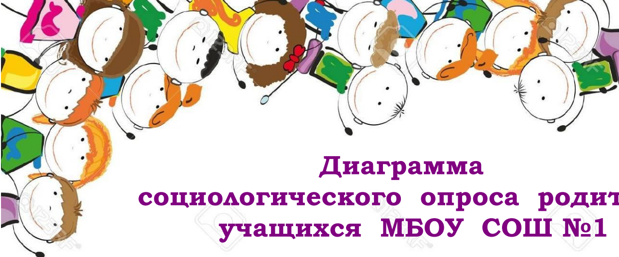
Диаграмма социологического опроса родителей учащихся МБОУ СОШ №1